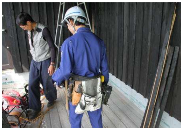
インターンシップ