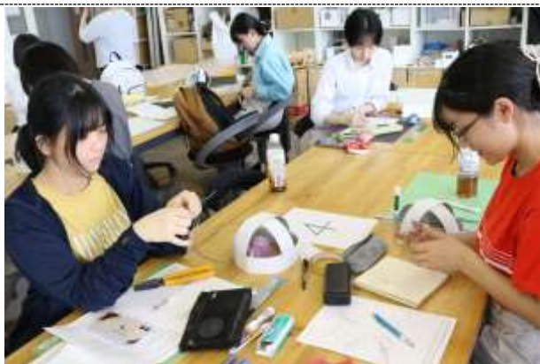
デザインスクール (2学年)