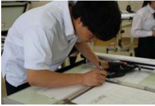
図 法 ・ 製 図 I、II