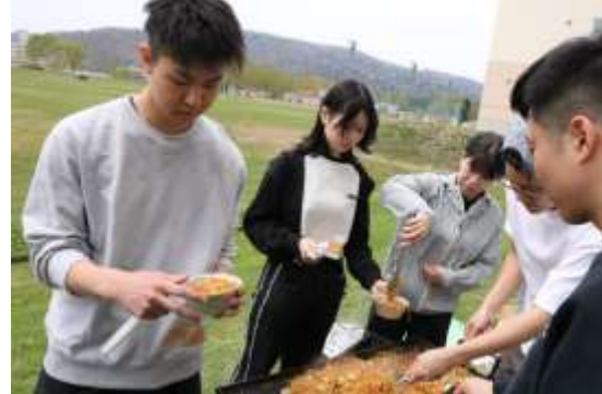
新入寮生歓迎会（5月）