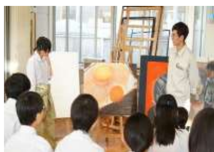
美 術 部