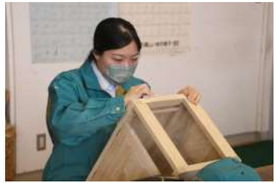
木 工 制 作 II