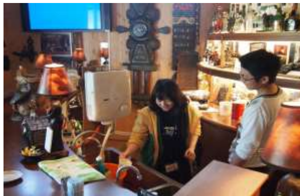
過去のボランティア活動の様子