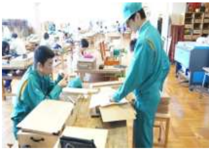
工 芸 部