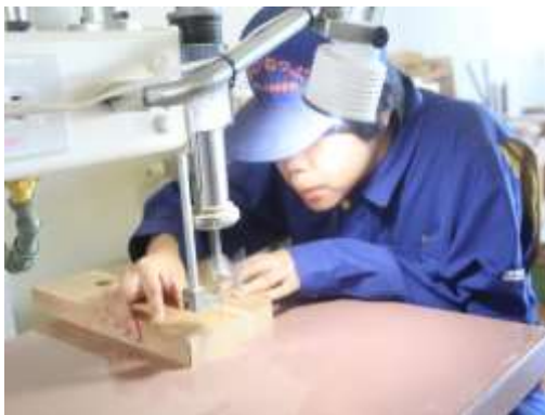
工 芸 制 作