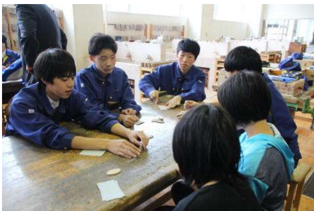
学校間連携（村内小中学校との連携授業）

※ その他、毎年、卒業前に卒業制作発表授業を行い、他学年との交流を深めています。また、インターンシップや一日体験入学、村内の小中学校との連携授業を通じた交流も行なっています。